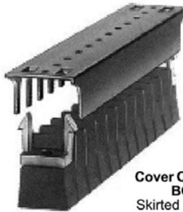
Cover Options BO Skirted access on one side only.