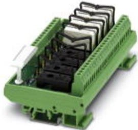
VARIOFACE module, for 8 plug-in miniature relays or miniature optocouplers, with LED, 230 V AC input voltage

Please be informed that the data shown in this PDF Document is generated from our Online Catalog. Please find the complete data in the user's documentation. Our General Terms of Use for Downloads are valid ( http://phoenixcontact.com/download )