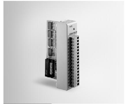
ADAM-5051 ADAM-5051D ADAM-5051S