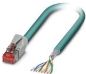
Assembled Ethernet cable, shielded, 4-pair, AWG 26 stranded (7-wire), RAL 5021 (sea blue), RJ45 connector/IP20 to free cable end, line, length 5 m

Please be informed that the data shown in this PDF Document is generated from our Online Catalog. Please find the complete data in the user's documentation. Our General Terms of Use for Downloads are valid ( http://phoenixcontact.com/download )