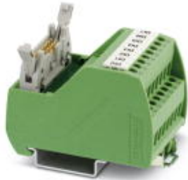
VARIOFACE Professional (VIP) module for Siemens ET200 ISP controllers

Please be informed that the data shown in this PDF Document is generated from our Online Catalog. Please find the complete data in the user's documentation. Our General Terms of Use for Downloads are valid ( http://phoenixcontact.com/download )