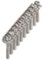
Fixed bridge, Number of positions: 10, Color: silver

Please be informed that the data shown in this PDF Document is generated from our Online Catalog. Please find the complete data in the user's documentation. Our General Terms of Use for Downloads are valid ( http://download.phoenixcontact.com )