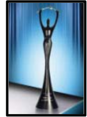
Electra Award 2005