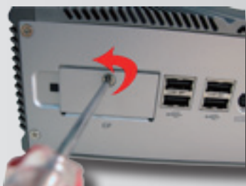
Unscrew and pull down the door