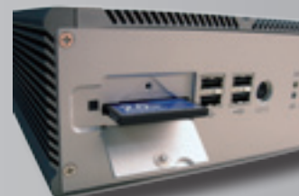
Insert CF card