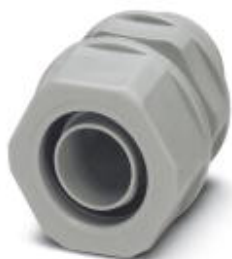
Cable gland made from PP with Pg thread, IP65 protection

Please be informed that the data shown in this PDF Document is generated from our Online Catalog. Please find the complete data in the user's documentation. Our General Terms of Use for Downloads are valid ( http://phoenixcontact.com/download )