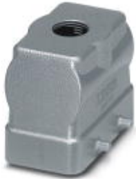
HEAVYCON B10 sleeve housing, for double locking latch, height: 56 mm, with 1 x M25 thread, straight cable outlet

Please be informed that the data shown in this PDF Document is generated from our Online Catalog. Please find the complete data in the user's documentation. Our General Terms of Use for Downloads are valid ( http://phoenixcontact.com/download )