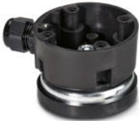
Outlet box with magnetic base for base mounting, black

Please be informed that the data shown in this PDF Document is generated from our Online Catalog. Please find the complete data in the user's documentation. Our General Terms of Use for Downloads are valid ( http://phoenixcontact.com/download )