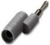
Reducing plug, Color: gray