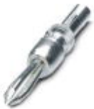
Test plugs, Color: silver