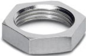
Flat nut with M8 thread

Please be informed that the data shown in this PDF Document is generated from our Online Catalog. Please find the complete data in the user's documentation. Our General Terms of Use for Downloads are valid ( http://download.phoenixcontact.com )