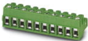
The figure shows a 10-position version of the product

PCB connector, nominal current: 12 A, number of positions: 8, pitch: 5 mm, connection method: Screw connection with wire protector, color: green, contact surface: Tin