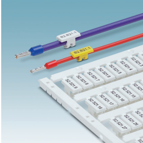
Figure may contain other products.