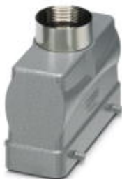
HEAVYCON B24 sleeve housing, for double locking latch, height: 65 mm, with 1 x M25 gland, straight cable outlet

Please be informed that the data shown in this PDF Document is generated from our Online Catalog. Please find the complete data in the user's documentation. Our General Terms of Use for Downloads are valid ( http://phoenixcontact.com/download )