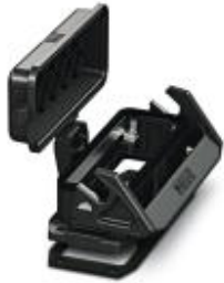
HEAVYCON EVO panel mounting base, plastic housing, B24, with single locking latch, height 30.5 mm, with flat gasket, with protective cover

Please be informed that the data shown in this PDF Document is generated from our Online Catalog. Please find the complete data in the user's documentation. Our General Terms of Use for Downloads are valid ( http://download.phoenixcontact.com )