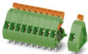
The figure shows the 10-position version

PCB terminal block, nom. voltage: 200 V, pitch: 3.81 mm, number of positions: 4, connection method: Spring-cage connection, color: green