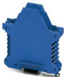
Component housing, color: blue

Please be informed that the data shown in this PDF Document is generated from our Online Catalog. Please find the complete data in the user's documentation. Our General Terms of Use for Downloads are valid ( http://phoenixcontact.com/download )