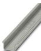
DIN rail, material: Steel, unperforated, 2.3 mm thick, height 15 mm, width 35 mm, length: 2 m

DIN rail - NS 35/15-2,3 UNPERF 2000MM - 1201798