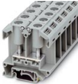
Universal terminal block with bolt connection, cross section: 1 - 25 mm 2 , width: 18 mm, color: gray

Please be informed that the data shown in this PDF Document is generated from our Online Catalog. Please find the complete data in the user's documentation. Our General Terms of Use for Downloads are valid ( http://download.phoenixcontact.com )