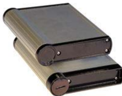
(click to enlarge) Flat Style (Top) Collar Style (Bottom)