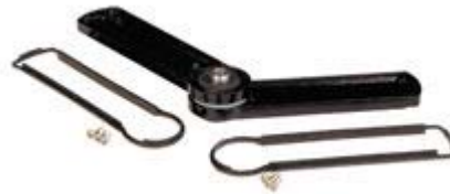
Variable Plate In Use