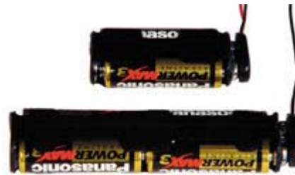
Cable Gland & Battery Kits