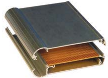
Example Application (Assembled View)