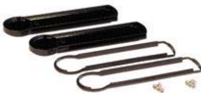
(click to enlarge) Flat Style