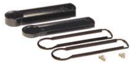
(click to enlarge) Collar Style