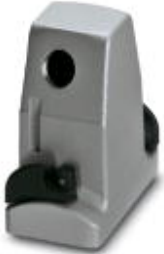
HEAVYCON ADVANCE EMV sleeve housing B6, with bayonet locking, height 100 mm, with 1xM20 thread, lateral cable outlet

Please be informed that the data shown in this PDF Document is generated from our Online Catalog. Please find the complete data in the user's documentation. Our General Terms of Use for Downloads are valid ( http://download.phoenixcontact.com )