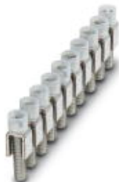
Fixed bridge, Number of positions: 10, Color: silver

Please be informed that the data shown in this PDF Document is generated from our Online Catalog. Please find the complete data in the user's documentation. Our General Terms of Use for Downloads are valid ( http://download.phoenixcontact.com )