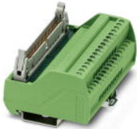
VARIOFACE termination board, to transmit max. 16 channels, only in connection with FLKM 50-PA-SLC 500 OUT/2 A

Please be informed that the data shown in this PDF Document is generated from our Online Catalog. Please find the complete data in the user's documentation. Our General Terms of Use for Downloads are valid ( http://phoenixcontact.com/download )