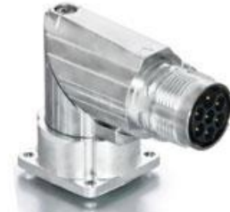
Contact Arrangement mating view

B ED C 880 NN 00 00 052A 000 B G C 880 N 00 00 052A 000