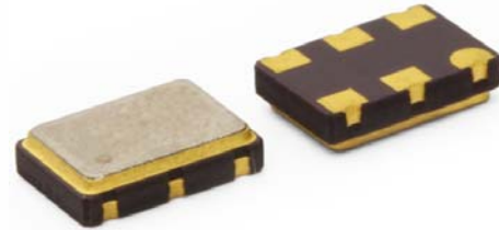
Part Dimensions: 7.0 × 5.0 × 2.0mm • 178.462mg