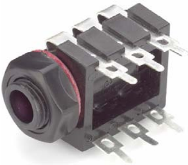
Model 7160 Horizontal 3-Conductor Jack, Solder Tabs