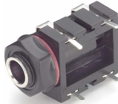
Model 7159 Horizontal 2-Conductor Jack, PC Board Mount