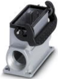
HEAVYCON box mounting base B16, with single locking latch, height 67 mm, with supports 2xM25

Please be informed that the data shown in this PDF Document is generated from our Online Catalog. Please find the complete data in the user's documentation. Our General Terms of Use for Downloads are valid ( http://download.phoenixcontact.com )