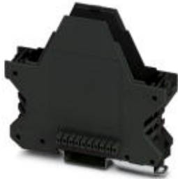
Component housing, color: black

Please be informed that the data shown in this PDF Document is generated from our Online Catalog. Please find the complete data in the user's documentation. Our General Terms of Use for Downloads are valid ( http://phoenixcontact.com/download )