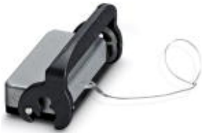
HEAVYCON protective cover, type B16, for sleeve housing without single locking latch, with retaining cord, IP65, ALU

Please be informed that the data shown in this PDF Document is generated from our Online Catalog. Please find the complete data in the user's documentation. Our General Terms of Use for Downloads are valid ( http://phoenixcontact.com/download )