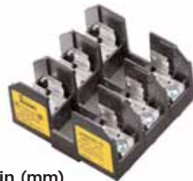
Dimensions - in (mm)

Features: Panel and DIN rail mount, adder block, retaining clip