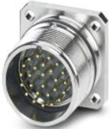
Contact carriers, M27, number of positions: 28, type of contact: Pin, Solder-in connection

Please be informed that the data shown in this PDF Document is generated from our Online Catalog. Please find the complete data in the user's documentation. Our General Terms of Use for Downloads are valid ( http://phoenixcontact.com/download )