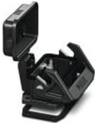
HEAVYCON EVO panel mounting base, plastic, B10, with single locking latch, height: 30.5 mm, with flat gasket, with protective cover

Please be informed that the data shown in this PDF Document is generated from our Online Catalog. Please find the complete data in the user's documentation. Our General Terms of Use for Downloads are valid ( http://download.phoenixcontact.com )