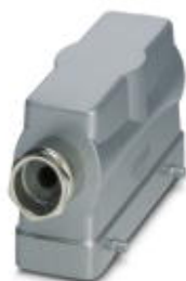
HEAVYCON B24 sleeve housing, for double locking latch, height: 76 mm, with 1 x Pg21 screw connection, lateral cable outlet

Please be informed that the data shown in this PDF Document is generated from our Online Catalog. Please find the complete data in the user's documentation. Our General Terms of Use for Downloads are valid ( http://phoenixcontact.com/download )