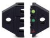
Spare die for CRIMPFOX-RCI 1

Replacement die - CRIMPFOX-RCI 1/DIE - 1212056