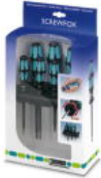
Screwdriver set, bladed/crosshead Pozidriv ® , 6-part, incl. rack

Please be informed that the data shown in this PDF Document is generated from our Online Catalog. Please find the complete data in the user's documentation. Our General Terms of Use for Downloads are valid ( http://download.phoenixcontact.com )