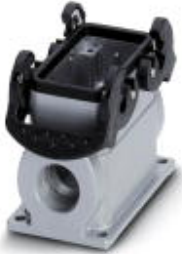
HEAVYCON box mounting base B10, with double locking latch, height 74 mm, with support 2xM32

Please be informed that the data shown in this PDF Document is generated from our Online Catalog. Please find the complete data in the user's documentation. Our General Terms of Use for Downloads are valid ( http://phoenixcontact.com/download )