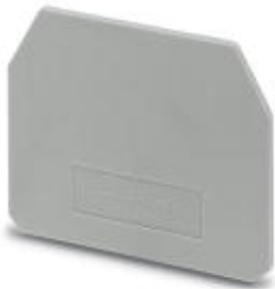
End cover, Length: 42.5 mm, Width: 1.5 mm, Color: gray

Please be informed that the data shown in this PDF Document is generated from our Online Catalog. Please find the complete data in the user's documentation. Our General Terms of Use for Downloads are valid ( http://phoenixcontact.com/download )