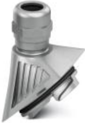
EVO metal cable gland with bayonet locking, B series, size M20, cable diameter: 7 - 13 mm

Please be informed that the data shown in this PDF Document is generated from our Online Catalog. Please find the complete data in the user's documentation. Our General Terms of Use for Downloads are valid ( http://phoenixcontact.com/download )