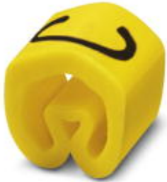
Conductor marking collar, labeled with the capital letter: Letters, yellow, width: 3.2 mm

Please be informed that the data shown in this PDF Document is generated from our Online Catalog. Please find the complete data in the user's documentation. Our General Terms of Use for Downloads are valid ( http://phoenixcontact.com/download )