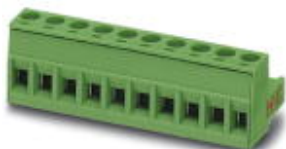
The figure shows a 10-position version of the product

PCB connector, nominal current: 16 A, number of positions: 3, pitch: 5.08 mm, connection method: Screw connection with tension sleeve, color: green, contact surface: Tin