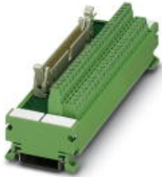
VARIOFACE module, with screw connection and flat-ribbon cable connector, for assembly on NS 35/7.5, 10 positions

Please be informed that the data shown in this PDF Document is generated from our Online Catalog. Please find the complete data in the user's documentation. Our General Terms of Use for Downloads are valid ( http://phoenixcontact.com/download )