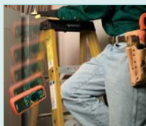
Drop-proof to 6 feet (2.9m)