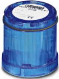
LED random flashing beacon element, 24 V DC, blue

Please be informed that the data shown in this PDF Document is generated from our Online Catalog. Please find the complete data in the user's documentation. Our General Terms of Use for Downloads are valid ( http://phoenixcontact.com/download )