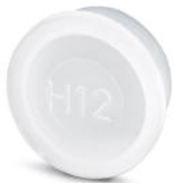
Plastic protection cap for connectors with M17 compact external thread

Please be informed that the data shown in this PDF Document is generated from our Online Catalog. Please find the complete data in the user's documentation. Our General Terms of Use for Downloads are valid ( http://phoenixcontact.com/download )