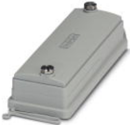
HEAVYCON ADVANCE, IP66, B24 protective cover for panel mounting side, with screw locking, with retaining cord, diameter of retaining cord eyelet: 3 mm

Please be informed that the data shown in this PDF Document is generated from our Online Catalog. Please find the complete data in the user's documentation. Our General Terms of Use for Downloads are valid ( http://phoenixcontact.com/download )