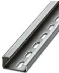
G-profile DIN rail, material: Steel, perforated, height 15 mm, width 32 mm, length 2 m

Please be informed that the data shown in this PDF Document is generated from our Online Catalog. Please find the complete data in the user's documentation. Our General Terms of Use for Downloads are valid ( http://download.phoenixcontact.com )