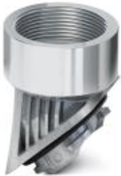
Adapter, aluminum, for EVO housing, NPT-3/4 inch thread

Please be informed that the data shown in this PDF Document is generated from our Online Catalog. Please find the complete data in the user's documentation. Our General Terms of Use for Downloads are valid ( http://phoenixcontact.com/download )