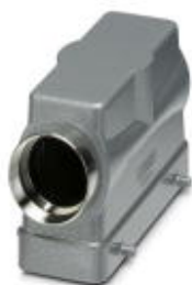
HEAVYCON sleeve housing B24, for double locking latch, height 76 mm, with support 1x M25, lateral conductor exit

Please be informed that the data shown in this PDF Document is generated from our Online Catalog. Please find the complete data in the user's documentation. Our General Terms of Use for Downloads are valid ( http://phoenixcontact.com/download )