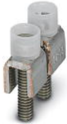
Fixed bridge, Number of positions: 2, Color: silver

Please be informed that the data shown in this PDF Document is generated from our Online Catalog. Please find the complete data in the user's documentation. Our General Terms of Use for Downloads are valid ( http://download.phoenixcontact.com )